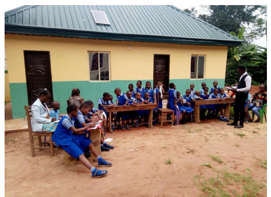
Divine Mercy basisschool project