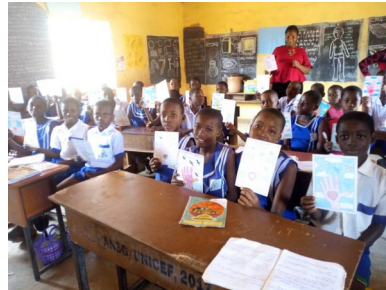
Amawbia basisschool project