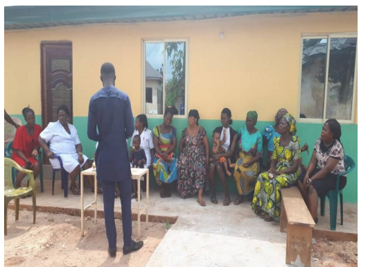
Ebenator gezondheidscentrum project