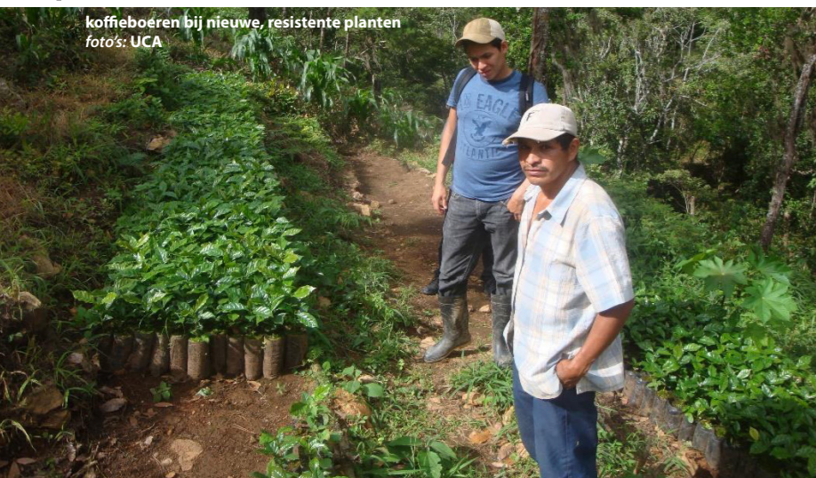
koffieboeren bij nieuwe, resistente planten

Wel is het onderwerp actueel in relatie tot de koffieteelt. De koffiewerkgroep is dan ook aan het bekijken of het thema klimaat wordt opgenomen in de activiteiten van de werkgroep.