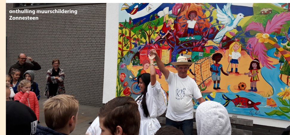
onthulling muurschildering Zonnestein