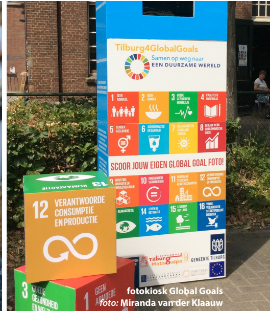
fotokiosk Global Goals