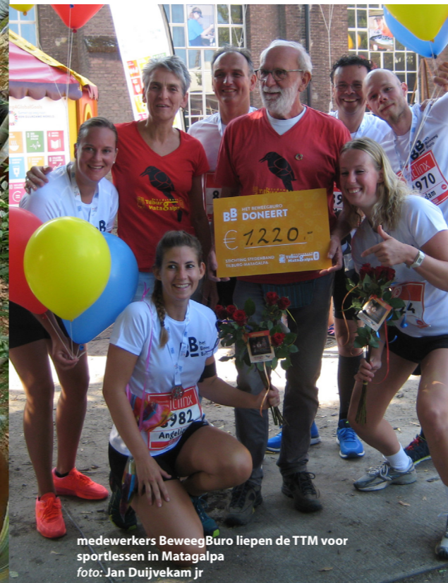
medewerkers BewegingBuro liepen de TTM voor sportlessen in Matagalpa