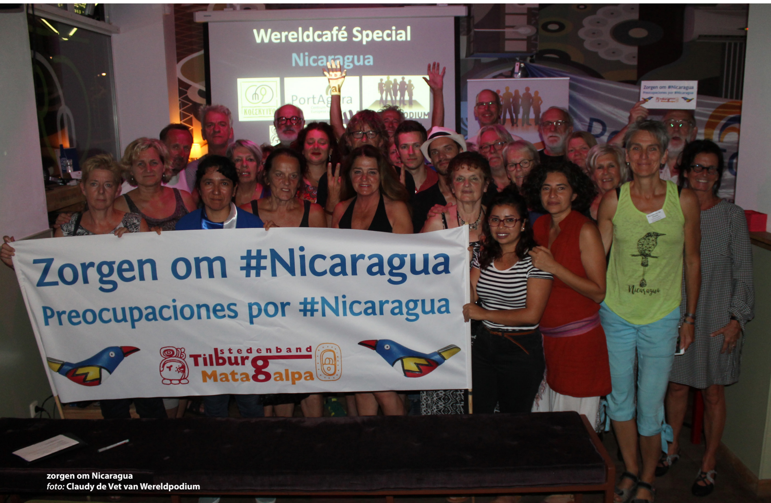
zorgen om Nicaragua