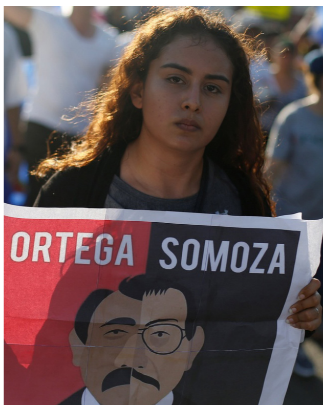
protesten en demonstraties in Nicaragua