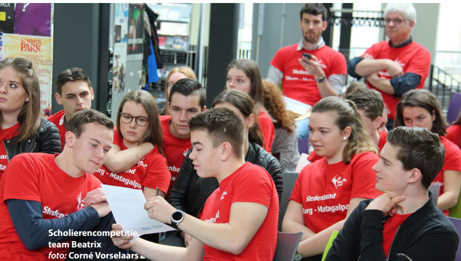
Scholierencompetitie team Beatrix