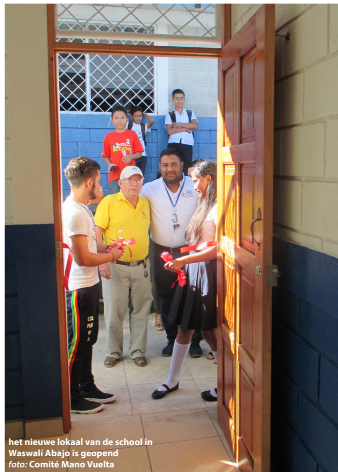
het nieuwe lokaal van de school in Waswali Abajo is geopend