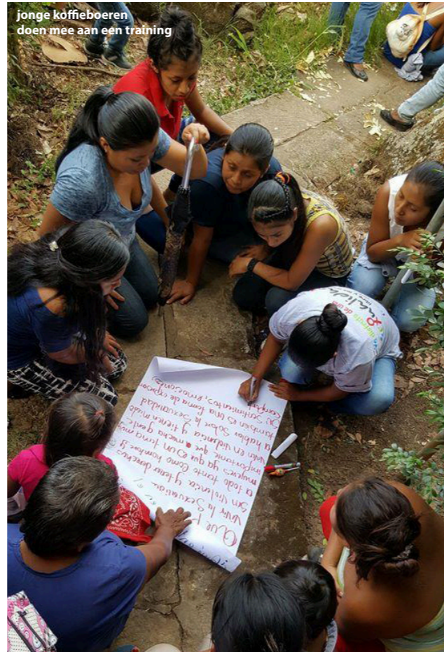
jonge koffieboeren doen mee aan een training