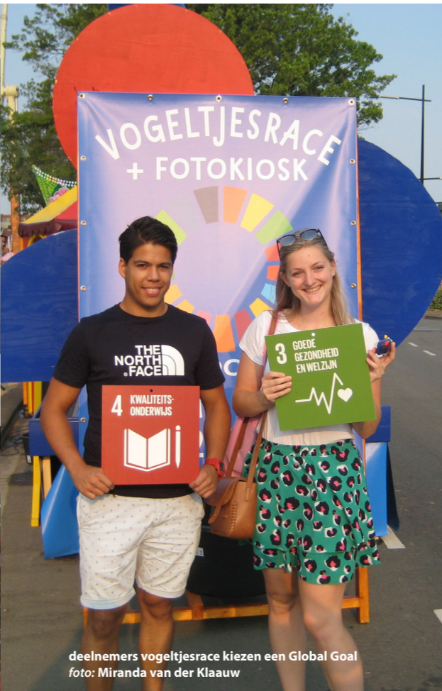
deelnemers vogeltjesrace kiezen een Global Goal