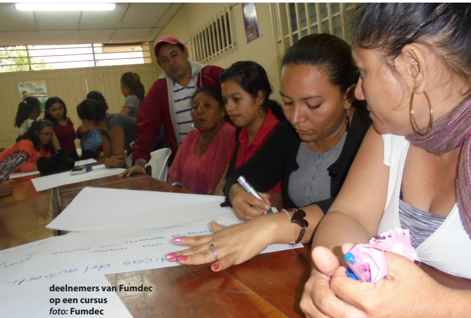
deelnemers van Fumdec op een cursus

Voor microkrediet werd 4.250 euro ingezameld, voor koffieboeren 6.500 euro. De Nieuwste School zamelde 6.000 euro in.