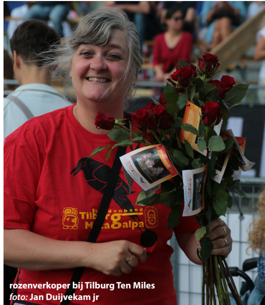
rozenverkoper bij Tilburg Ten Miles