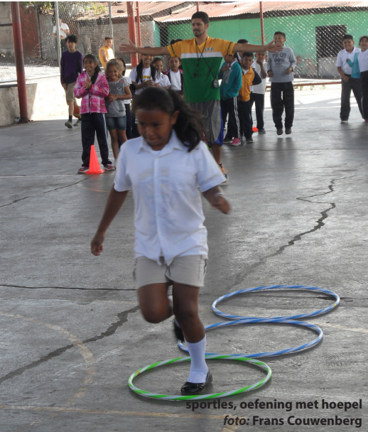
sportles, oefening met hoepel