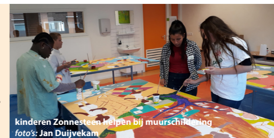
kinderen Zonnestein helpen bij muurschildering