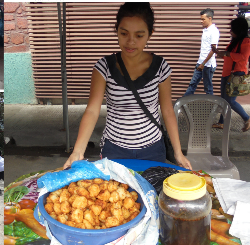
deze vrouw gebruikt het krediet voor de productie van snacks