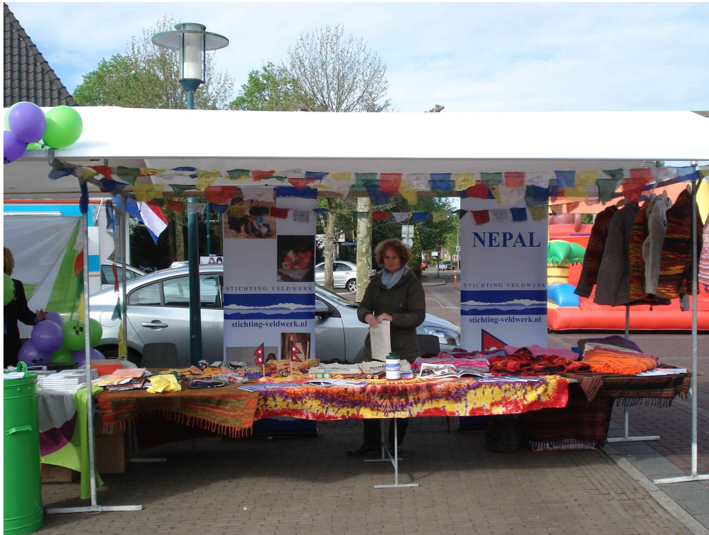
Markt in Heiloo

worden daar ook kleding, gebedsvlaggetjes e.d. verkocht. Naamsbekendheid en uiteindelijk sponsorgeld is het doel van deze activiteiten..