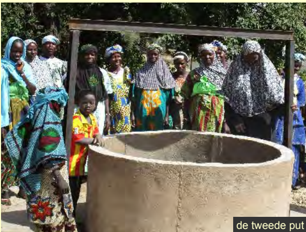
de tweede put

In 2014 hebben we een tweede waterput geslagen in de groentetuin van Sirabougou en in 2015 in die van Kokoro. Tevens zijn de omheiningen van de drie groentetuinen verstevigd om de gewassen te beschermen tegen loslopende dieren.