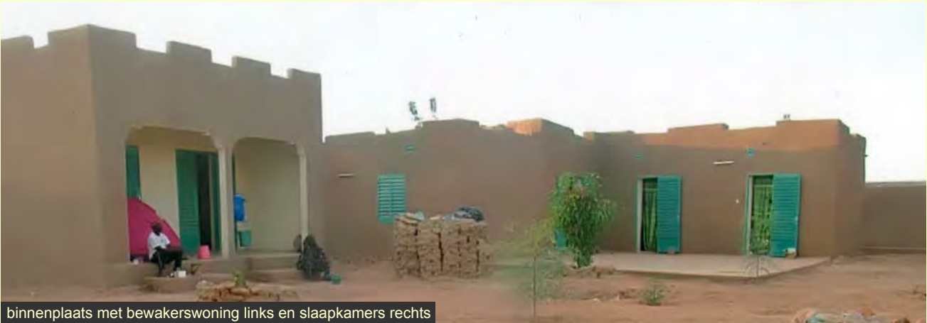
binnenplaats met bewakerswoning links en slaapkamers rechts

In 2015 is met de bouw van een gemeenschappelijke zaal met dak, een keuken, een bewakershuisje (voor bewaker en diens vrouw, die ook meehelpt met de dagelijkse werkzaamheden) en twee slaapkamertjes om (6) zieke kinderen op te vangen, het kindercentrum Aprosédé in Douentza voltooid. Op de binnenplaats zijn 5 moringabomen geplant. Men is ook begonnen met het geven van maaltijden aan straatkinderen. Fatoumata Ongoiba stuurde foto's met rapportage en uitgavenlijst met facturen.