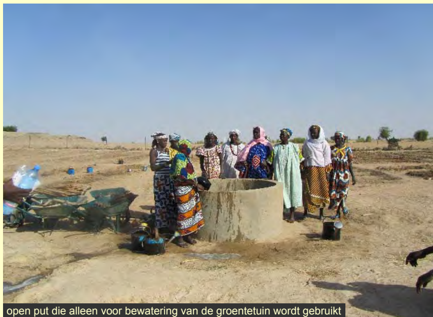
open put die alleen voor bewatering van de groentetuin wordt gebruikt

In de afgelopen jaren hebben we meerdere waterputten geslagen in de groentetuinen van Mamari-bougou, Sirabougou en Kokoro in de commune van Diaptody, ten noorden van Mopti: met de woestijn nabij een kwetsbaar gebied met 5000 inwoners, die hard moeten werken om er te kunnen blijven wonen. Sinds 2003 hebben we er vele projecten verwezenlijkt: drie groentetuinen, zes waterputten, een school met waterput en wc's, twee zeepmakerijen voor vrouwen, ondersteuning aan een kleine medische post.