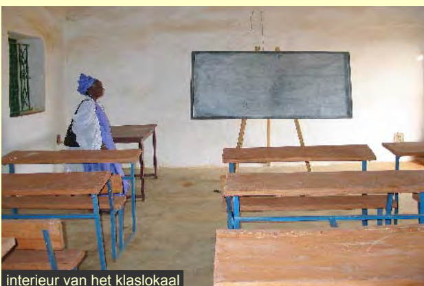
interieur van het klaslokaal

Vrouwen en kinderen volgen er onderwijs. De kinderen leren er ook ambachten en worden begeleid om een passende baan te vinden. Dat is heel divers: een minder begaafde jongen wordt bijvoorbeeld geitenhoeder, een door polio gehandicapte doet administratief werk, meisjes leren stoffen te verven en te bewerken. Inmiddels hebben zo'n 600 kinderen en 300 vrouwen er alfabetiseringscursussen gevolgd en zijn zeven leerlingen zelfs doorgestroomd naar de universiteit in Bamako. Er zijn thans 50 families lid, die de kinderen thuis kunnen opvangen.