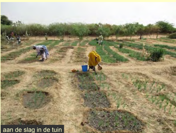
aan de slag in de tuin