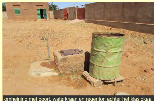
omheining met poort, waterkraan en regenton achter het klaslokaal