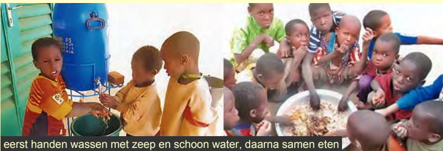
eerst handen wassen met zeep en schoon water, daarna samen eten

We kunnen nu verder met het tweede gedeelte van het project; zorgen dat de vrouwen constructief een inkomen gaan verdienen; met de opbrengsten uit de groentetuin en de verkoop van zelfgemaakte kleding. Een tweede proef, waarbij vrouwen jurken hebben gemaakt ter gelegenheid van het offerfeest (Tabaski), bleek succesvol. De stoffen konden worden gekocht van de gift van het Struanfonds en werden daarna eigenhandig geverfd. De meisjes van het kindercentrum gaan meehelpen. Binnen 5 jaar moet het centrum geheel zelfstandig functioneren.