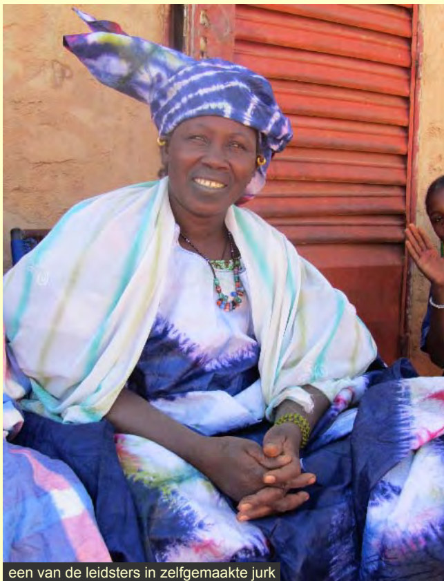
een van de leidsters in zelfgemaakte jurk

Er wordt een Commissie van beheer opgezet, die toeziet op verdeling van kosten en lasten. De inwerkingstelling van dit systeem zal heel duidelijk uitgelegd worden middels een cursus voor de vrouwen.