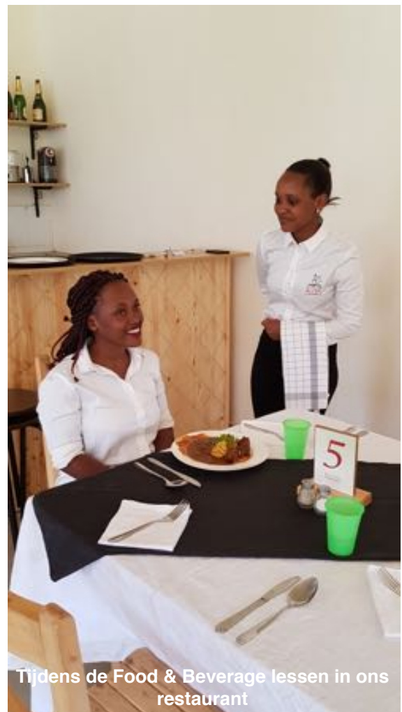
Tijdens de Food & Beverage lessen in ons restaurant

Binnen een traject van 12 maanden leren ze de basis van het hospitality vak. Deze bestaat