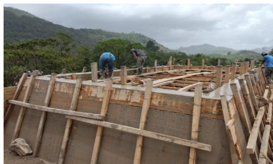
De grote distributietank voor 83 families

Schoon drinkwater betekent fittere, gezondere kinderen die naar school kunnen. Een ander gevolg is dat ook de medische kosten dalen en het welvaartspeil dus stijgt. Een bezoek aan de dokter en bijkomende medicijnkosten betekenden vaak een aanslag op de weinige financiële middelen. We zeggen wel eens: in de 6 maanden die de aanleg gemiddeld vergt gaan de mensen 60 jaar in de tijd vooruit.