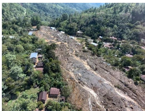
Deel van de berg weg met ca. 100 huizen

Het bedrag is bestemd voor voedsel en kleding. Momenteel zijn de getroffen mensen ondergebracht in scholen en kerken en is hun toekomst ongewis. Teruggaan naar hun oude plek is onmogelijk, want die is er niet meer. Bovendien is ook de maisoogst op hun eigen akkers verloren gegaan, dus honger blijft een reële dreiging.