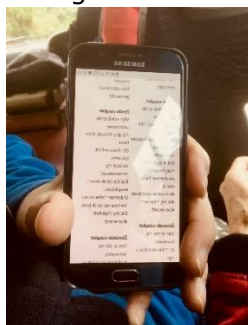
Even oefenen onderweg