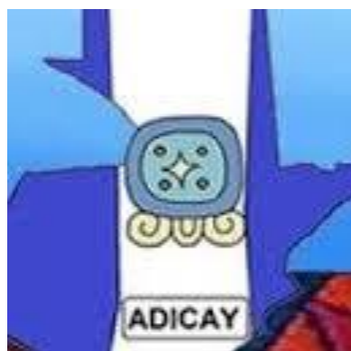
Onze Partners in Guatemala: Adicay en

Met Wilde Ganzen hebben we al sinds 2011 een jarenlange samenwerking. Een samenwerking waar we blij mee zijn. Niet in de laatste plaats omdat wij door de hoge eisen die zij stellen 'scherp' blijven en steeds de lat blijven hoog leggen.