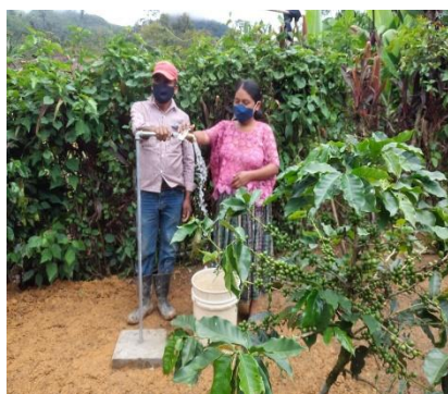
Heel blij met hun kraan. De pila komt nog

Schoon drinkwater betekent fittere, gezondere kinderen die naar school kunnen. Een ander gevolg is dat ook de medische kosten dalen en het welvaartspeil dus stijgt. Een bezoek aan de dokter en bijkomende medicijnkosten betekenden vaak een aanslag op de weinige financiële middelen. We zeggen wel eens: in de 6 maanden die de aanleg gemiddeld vergt gaan de mensen 60 jaar in de tijd vooruit.