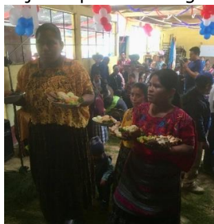
Feestmaal bij de inauguratie

In 2019 is in San Marcos Chamil ons 11 e drinkwaterproject gerealiseerd. Op 18 januari 2020 werd dit blijde dorp door ons gehele bestuur geïnaugureerd.