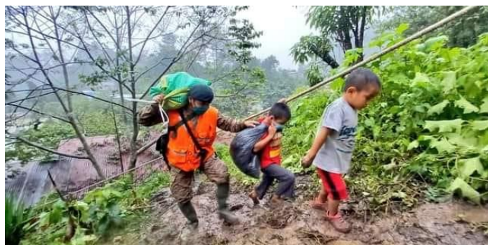
Op weg naar waar? Met al hun resterende bezittingen