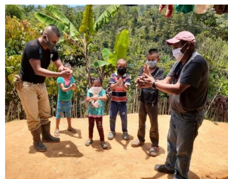
"Coronales" voor de kleinsten