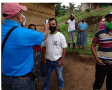
Wel rekening houden met Corona

Een voorwaarde om in aanmerking te komen voor het systeem is dat de dorpingen zelf bijdragen door mee te werken bij het graaf- en sjuwwerk, het leveren van hout, zand en stenen. Hierdoor wordt een project hun eigen project.