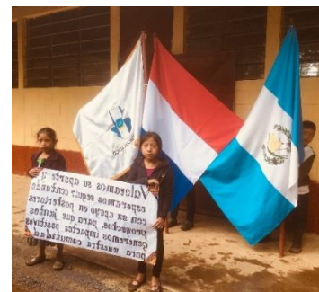
Heel blij met schoon drinkwater