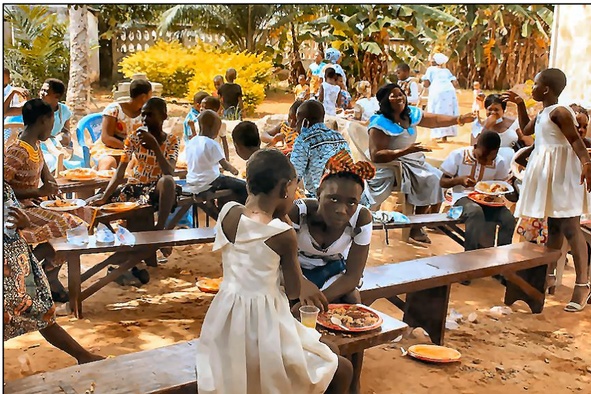
Een extraatje voor de omwonenden.

In hoofdstuk 4.1 is beschreven welke concrete projecten op dit moment onze aandacht hebben.