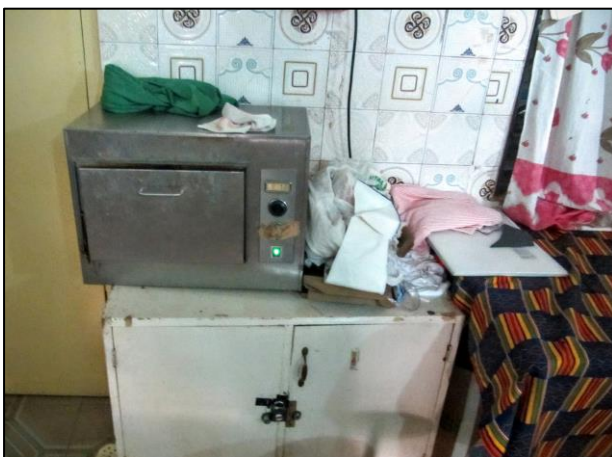
Inventaris in de 'Delivery room'

In het kader van de AVG zullen wij in het seizoen 2021/2022 beginnen met het opstellen van een privacy protocol zodat wij aan het einde van de periode voldoen aan de wettelijke regelgeving.