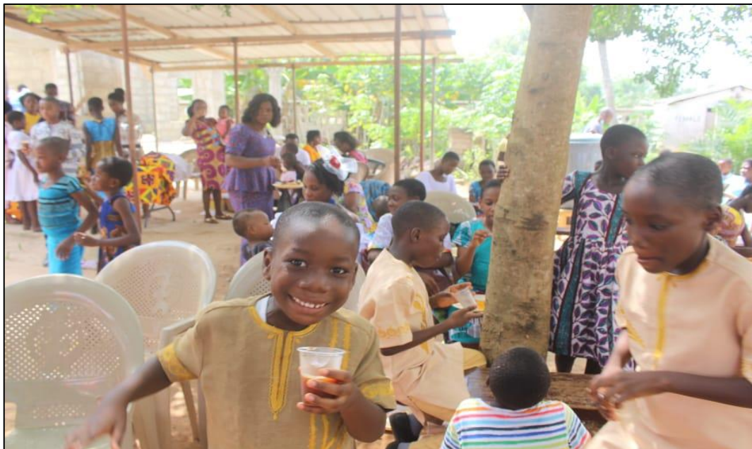
Kerstviering in en om het ziekenhuis.

Spontane activiteiten kunnen zich altijd aandienen en zowel qua projecten als qua fondsenwerving zullen wij deze onverwachte kansen niet laten liggen. Wij houden ons hierbij wel aan de door ons geformuleerde missie, medische apparatuur en hulp in brede zin voor de kwetsbare. De donateurs weten hierdoor altijd in grote lijnen waarvoor zij doneren.