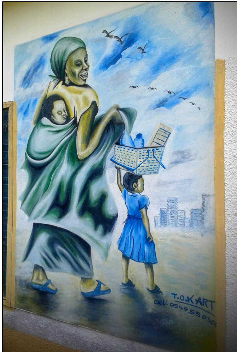
Wandversiering in de gang van het ziekenhuis.