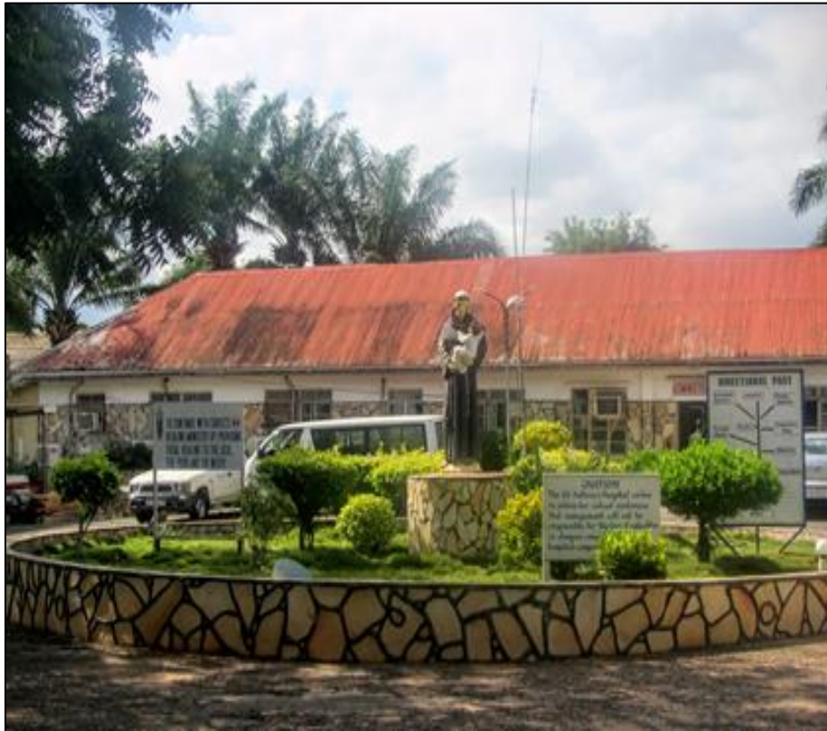
St. Anthony's Hospital in Dzodze, Ghana.

SOSSAH werkt nauw samen met het St. Anthony's Hospital in Dzodze, Ghana.