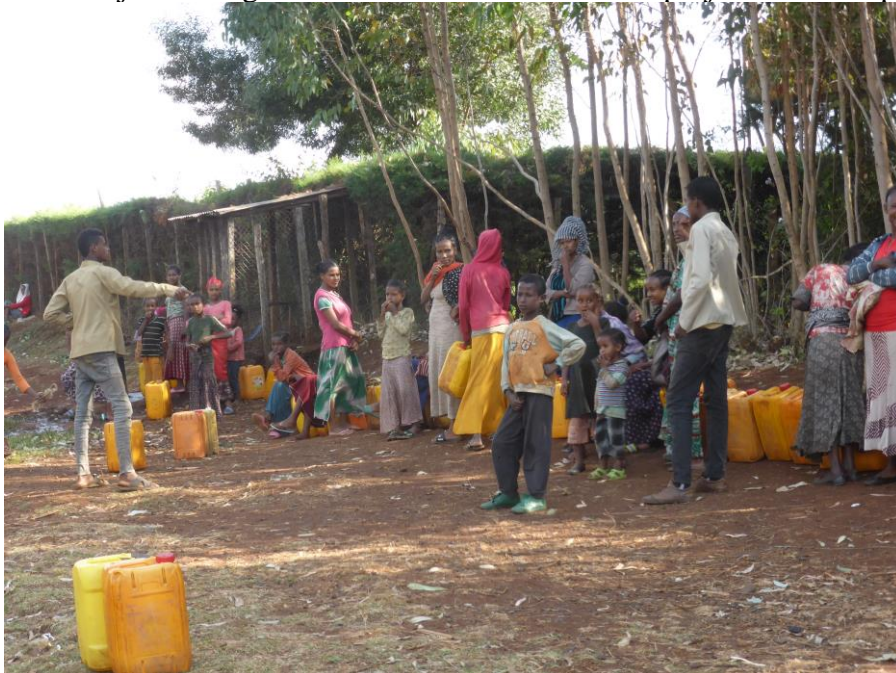
In Getema zijn nieuwe bronnen hard nodig.

In januari 2020 heeft Dick Jungst een bezoek gebracht aan de projecten in Ethiopië en Uganda. Over zijn ervaringen in deze landen en rond onze projecten staan op de site.