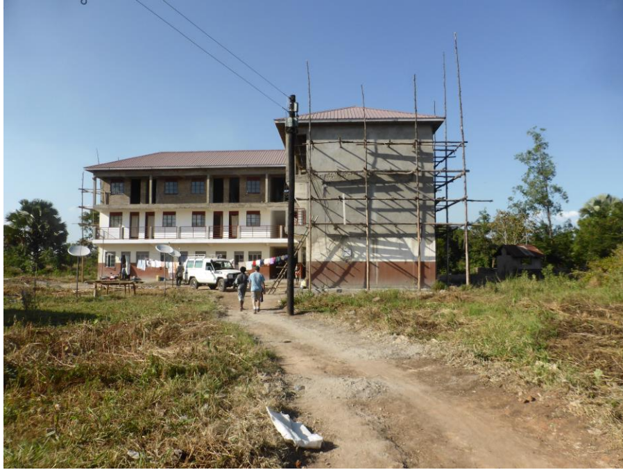
Pope Johns' Staff houses in aanbouw

In 2020 liggen de inkomsten op hetzelfde niveau als in 2019. Inkomsten uit bijzondere donaties (anders dan van Rotary) zijn gedaald evenals van acties. Deze waren in Corona-jaar 2020 vrijwel niet mogelijk. Dit wordt gecompenseerd door acties op persoonlijk initiatief vanuit de medische sector. Met deze geste zijn we erg ingenomen. De lijfrenten en donaties (zowel qua bedrag als aantal) zijn fors gestegen. Er zijn de nodige reacties gekomen op onze oproep voor de ondersteuning van een aantal Corona-projecten bij partners waar we al eerder ondersteuning hebben geboden.