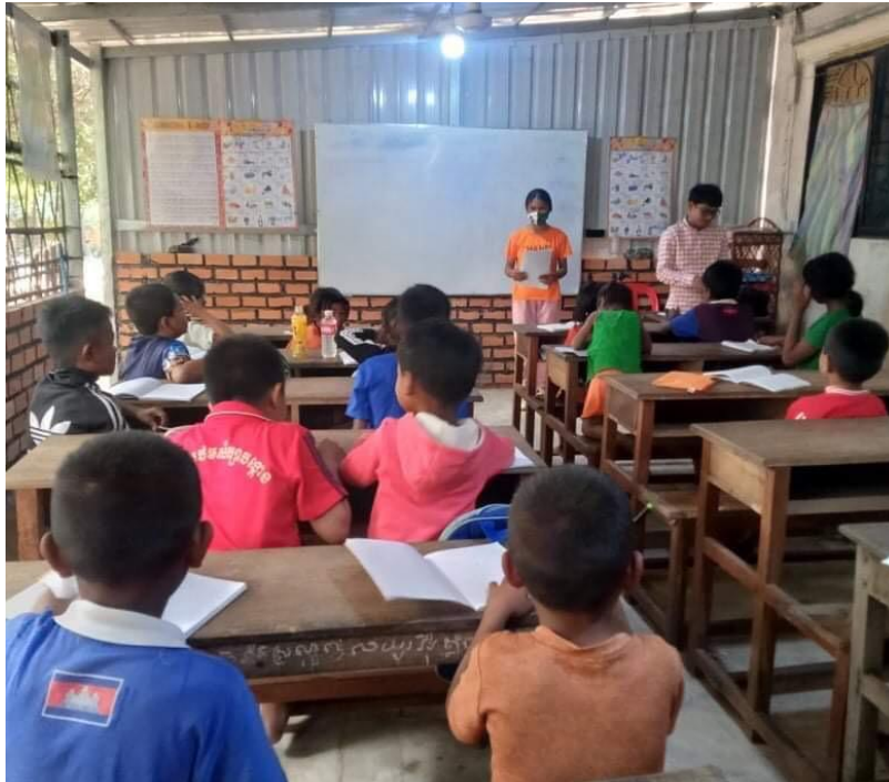
Onze jongeren, op een schooltje in de community, geven les over het milieu

Zoals gezegd, laten we in ons project Educatie en Milieu 'hand in hand gaan'.