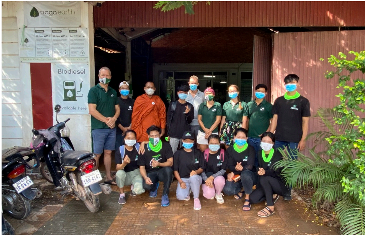
Bij Naga Earth

In ieder project dat werkt met studenten is continuïteit een belangrijke zorg. Chikara Cambodia, zowel het lokale als het Nederlandse team, besteedt heel veel tijd aan de individuele studenten. Ook worden er veel groepsopdrachten vervuld. Bijvoorbeeld de 'Environmental Projects'. Het feit dat de studenten geacht worden om voor de support die ze krijgen iets (gezamenlijk) terug te doen, heeft een sterk motiverend effect. In de afgelopen twee jaar hebben we dan ook geen uitval en hopen dat dit zo blijft.