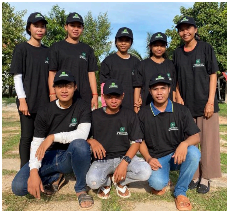
'De Parels van Cambodja'