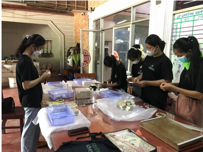
De jongeren zijn bezig met de zeep productie

Ook gaan de jongeren aan de slag met de productie van gerecyclede bio-cleaner, die ze naar motorfiets werkplaatsen brengen. Ze leren de monteurs in deze werkplaatsen over 'Reuse, Refill en Recycling' en hoe ze op een milieuvriendelijke wijze de motoren kunnen schoonmaken.