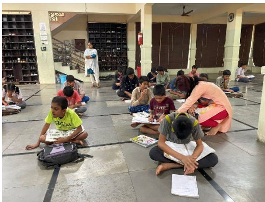
Hyderabad, Dutch School project. De kinderen krijgen ook yogalessen.

In India gebeurt het helaas maar al te vaak dat kinderen met schisis - en speciaal meisjes - te vondeling worden gelegd of gewoon op straat worden achter gelaten omdat de ouders niet weten wat ze met een kind met een zichtbare afwijking aan moeten. Deze kinderen wonen in een kindertehuis, dat onderdeel is van het Craniofacial Institute te Hyderabad. Naast de schisisoperaties krijgen zij ook onderdak, voeding, verdere medische verzorging en onderwijs van lagere school tot universiteit. Zo helpen we hen op weg naar een baan en een volwaardig bestaan in de samenleving. Samen met enkele donateurs ondersteunen wij 22 kinderen voor minimaal 8 jaar.