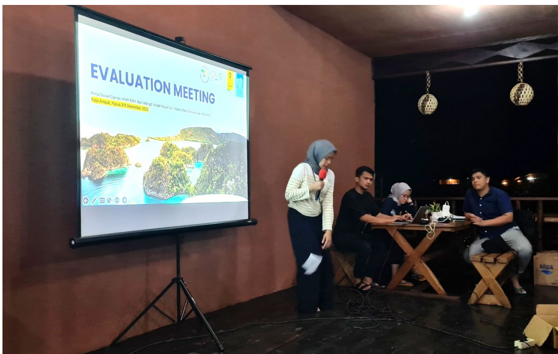
Avondlijke nabespreking op Rajah Ampat (Papua) na een dag met operaties in december 2022.