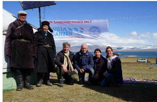
Het huidige bestuur met bestuursleden van partner Source of Steppenomads NGO in 2019