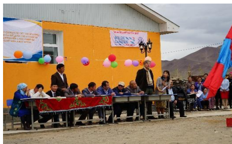
Opening nieuwe kleuterschool