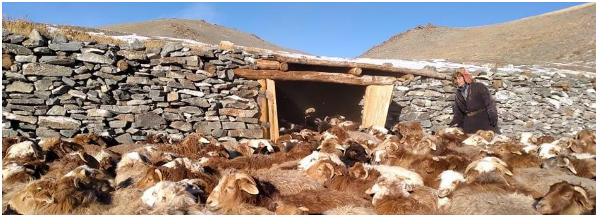
Afb. Eenvoudig stenen dieronderkomen voor 500 dieren voor 5 herder families

Het beleidsplan is vooral geschreven voor de direct bij onze stichting betrokken personen en organisaties zoals donateurs en vrijwilligers en daarnaast voor alle personen of organisaties die geïnteresseerd zijn in de activiteiten van onze stichting.