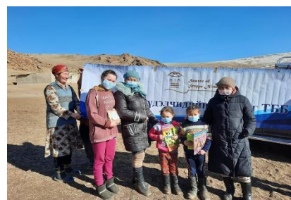
Voorlichting & uitgifte materialen