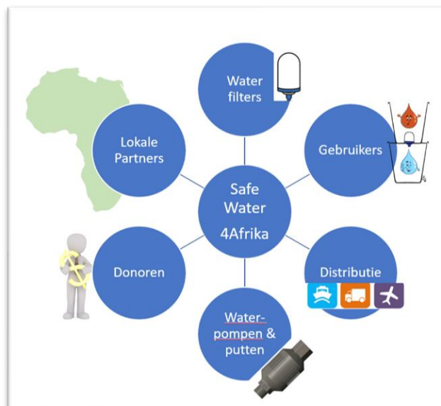
Figuur 1: De belangrijkste thema's voor Safe Water 4 Afrika

C1. Awareness workshop, trainings workshops, ad-hoc advies en begeleiding van bijvoorbeeld lokale groepen ondernemende boeren, die d.m.v. een klein irrigatieproject specifieke groenten en fruit willen gaan verbouwen en vermarkten.